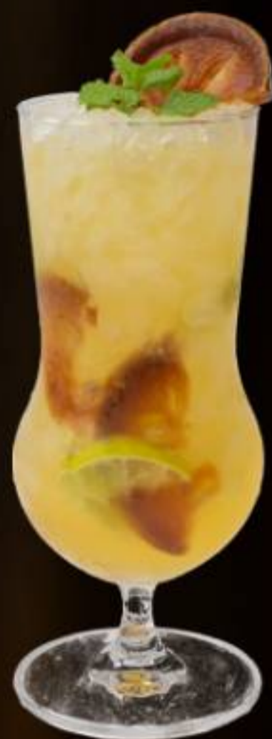
THAI STYLE / 泰式风情 Bael Fruit Juice, Lime Juice Mint Leave 青柠汁, 木橘, 糖浆, 薄荷

เครื่องดื่มไม่มีแอลกอฮอล์ 无酒精鸡尾酒 (140.-)