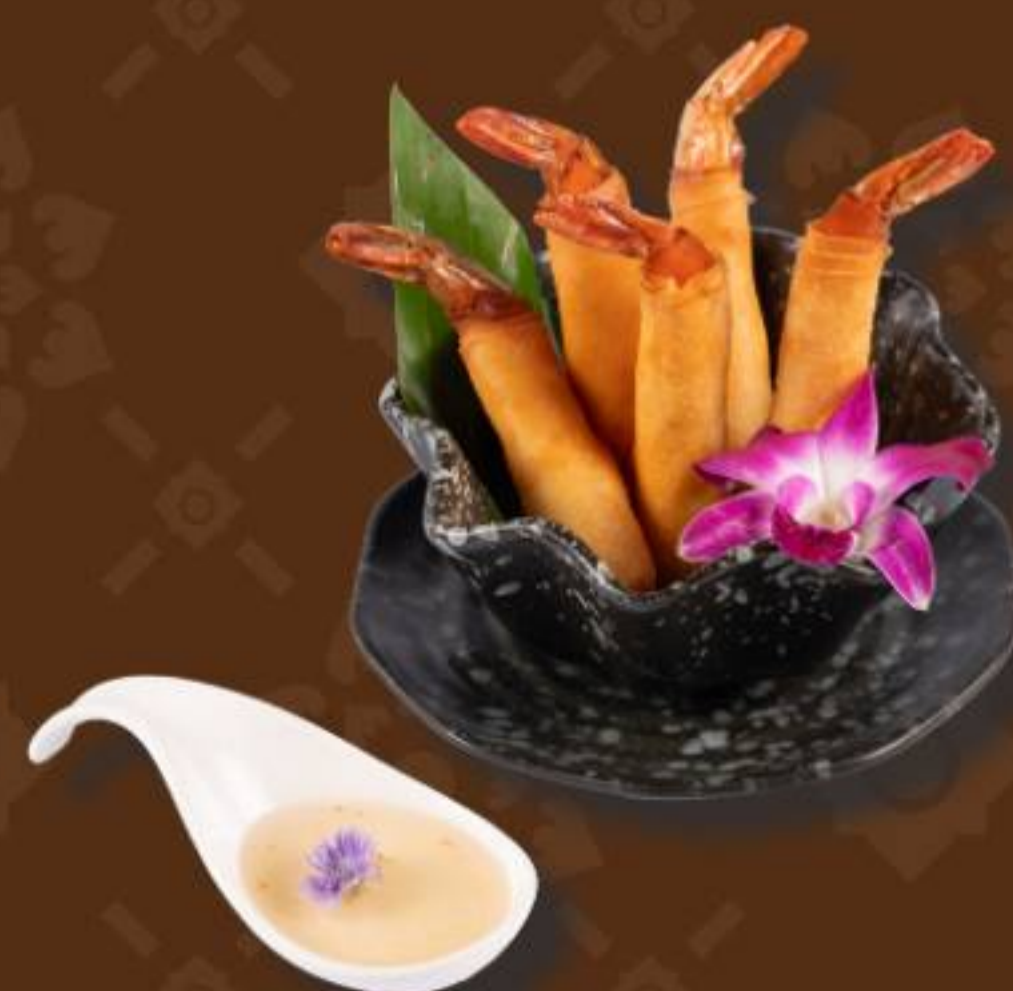
ปอเปี๊ยะกุ้งทอด Deep-Fried Shrimp Spring Rolls Served with Plum Sauce 炸虾春卷配梅子酱