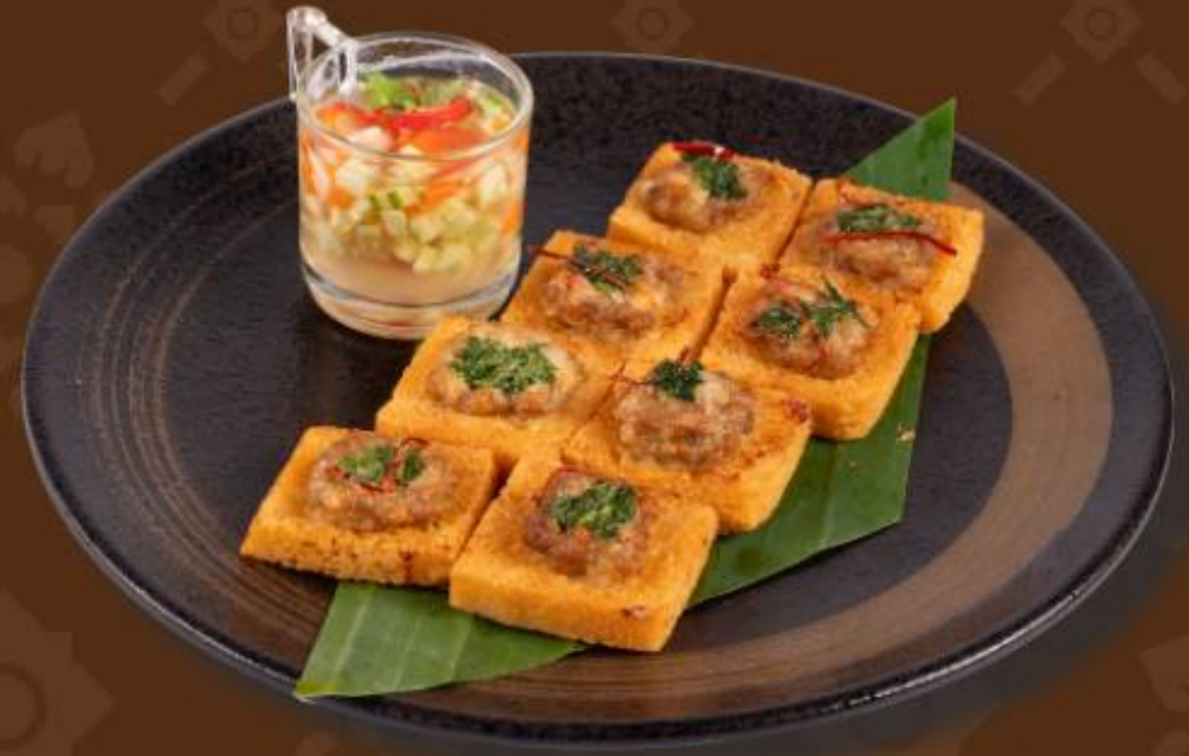
ขนมปังหน้าหมู-กุ้ง Deep -Fried Toasted with Minced Pork and Prawn Spread Served with Plum Sauce 炸猪肉虾碎面包