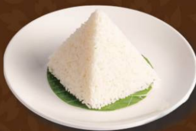
ข้าวหอมมะลิ Jasmine Rice 茉莉香米