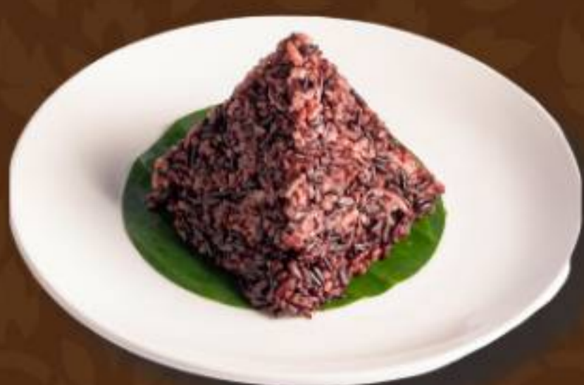
ข้าวหอมนิล Aromatic Thai Black Rice 泰式黑香米