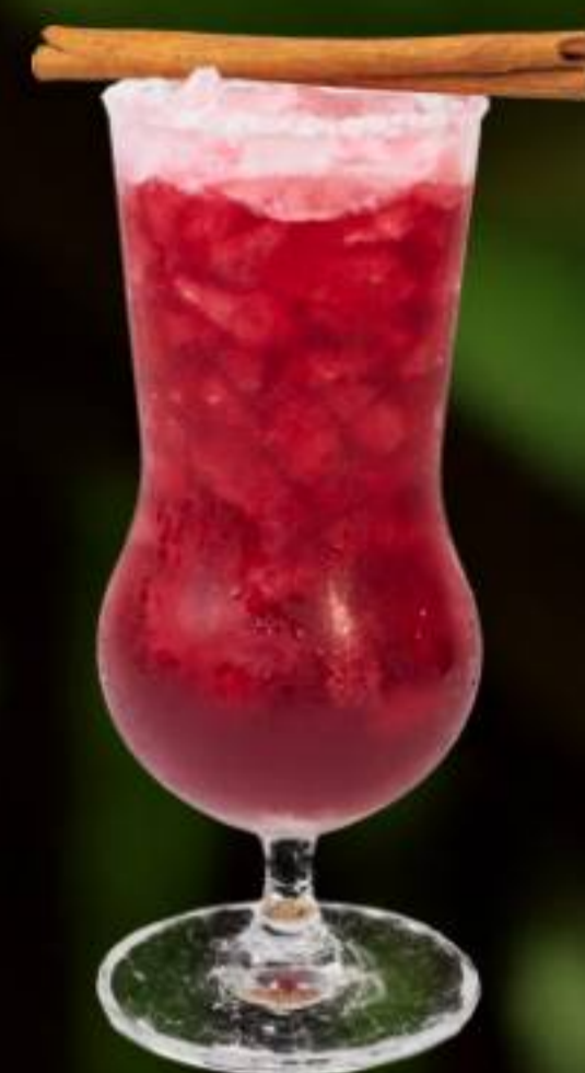
KAM KHONG / 跨湄公 Roselle Juice, Lime Juice, Mint Leave 洛神花糖浆, 青柠粉, 薄荷