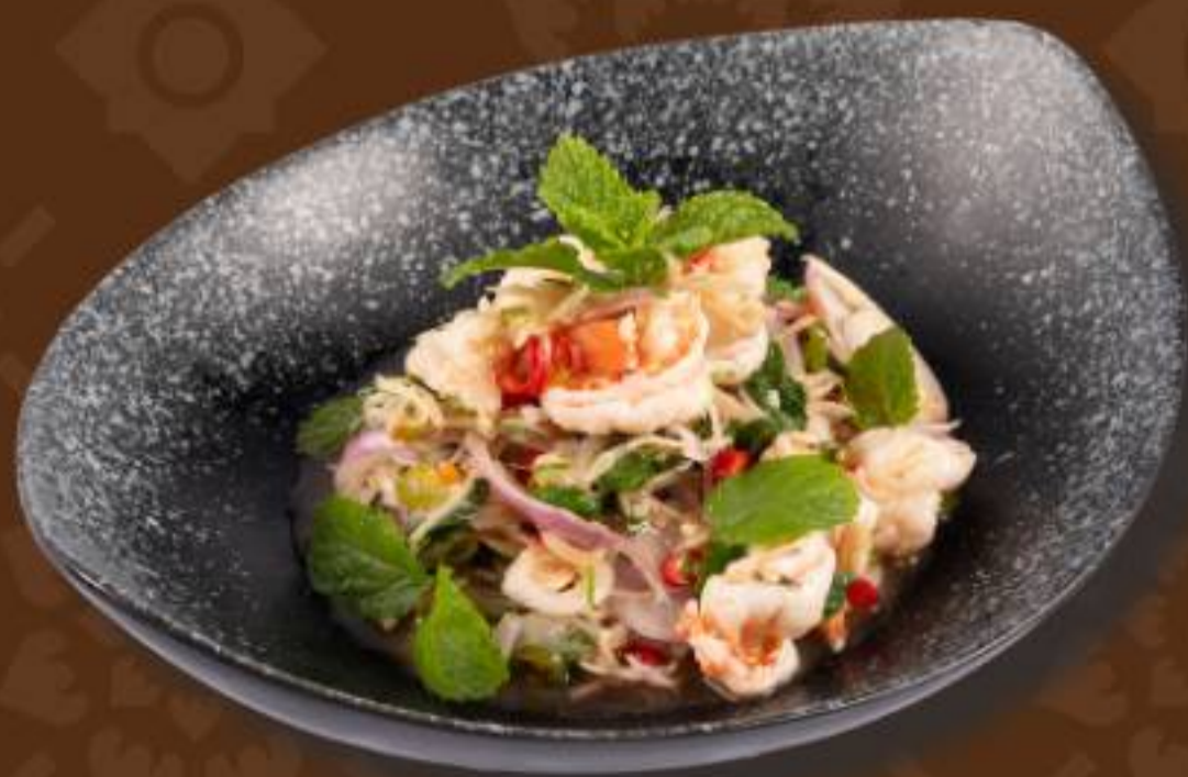
แสร้งว่ากุ้ง Ancient Thai Spicy Shrimps Salad 古法泰式香辣虾沙拉