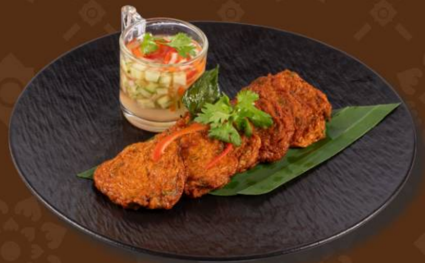
ทอดมันปลาทราย Deep-Fried Marinated Fish with Curry Paste Long Beans, Kaffir Lime Leaves Served with Sweet Chili and Cucumber 泰式小丑刀鱼饼