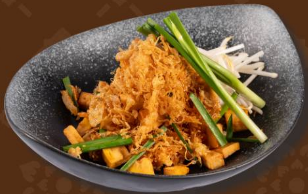
หมีกรอบโบราณ Crispy Rice Noodles Mixed in Reduced Sweet and Sour Dressing 泰式传统脆面