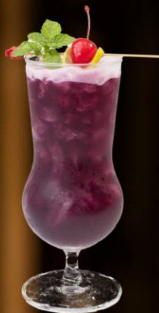
CHARM KARAKED / KARAKED 魅力 Mixed Berry Juice, Lime Juice Butterfly Pea Juice, Mint Leave 混合莓果汁, 青柠汁, 糖浆, 蝶豆花汁, 薄荷