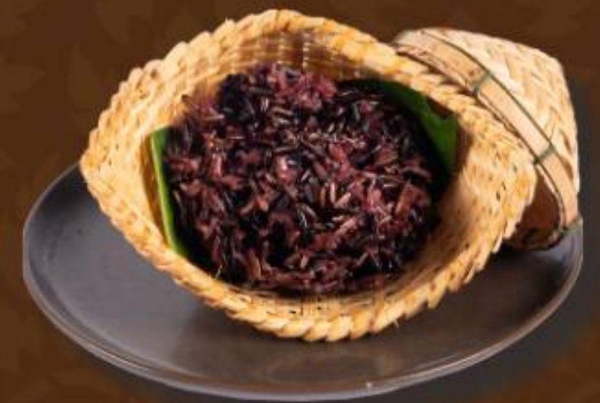
ข้าวเหนียว Sticky Rice 糯米饭