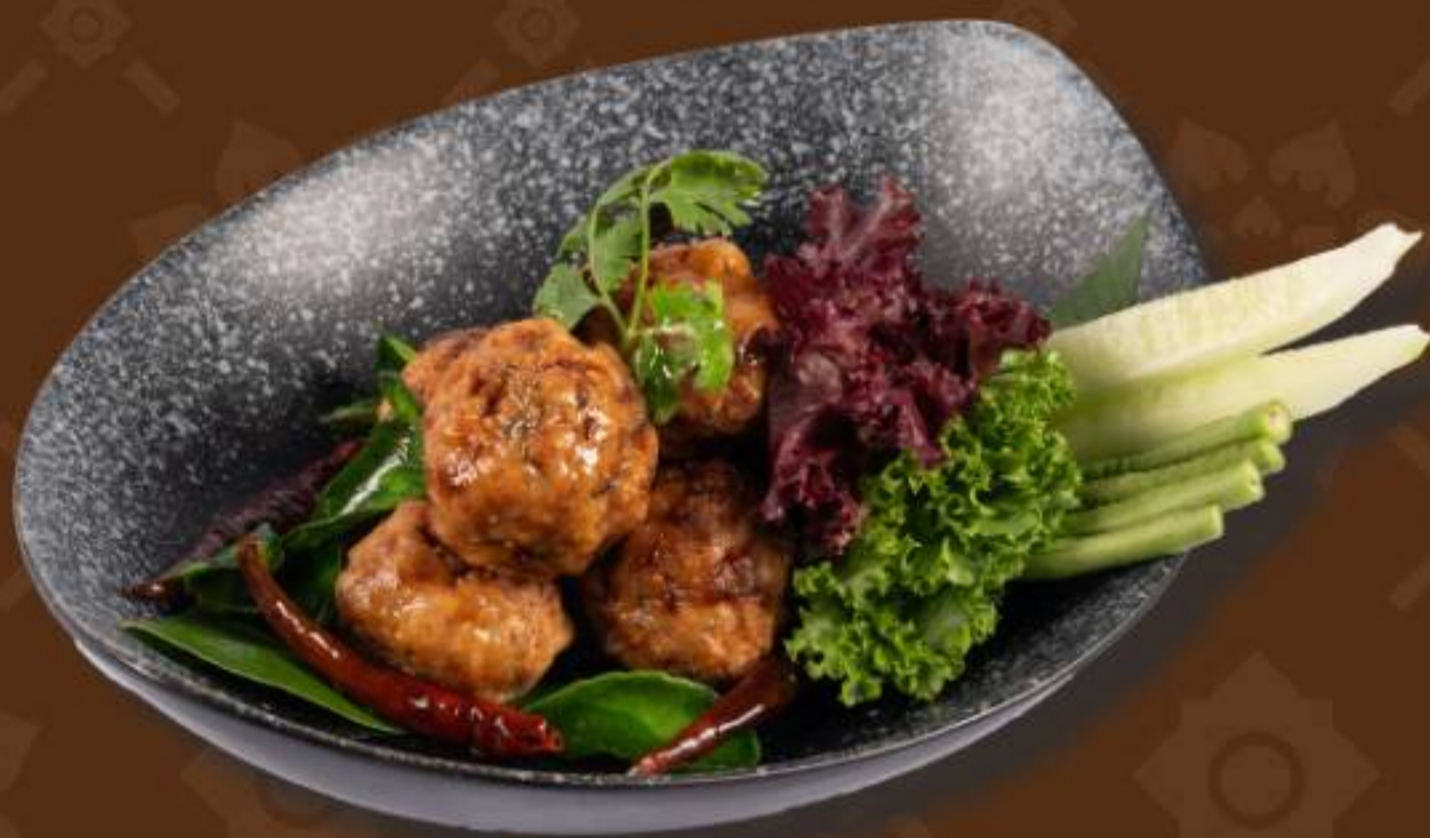
ลาบหมูทอด Deep- Fried Spicy Minced Pork Ball with Thai Herbs 泰式东北炸猪肉丸配香草